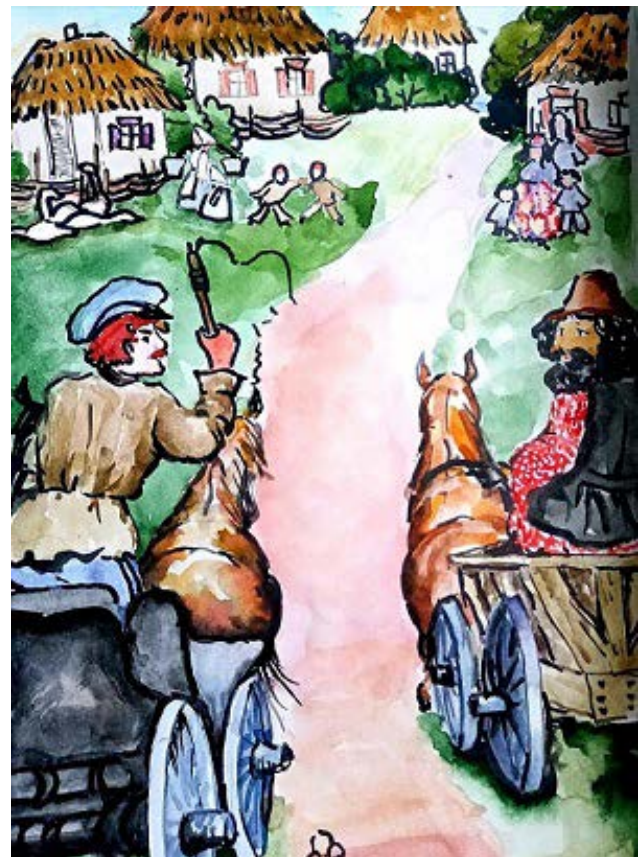
Рис. 2. Казак возвращает жителя Каира на место проживания. Автор рисунка – С. Гнутова

Цыган, самовольно покидавших места жительства, власти возвращали обратно; некоторых привлекали к суду, а затем отправляли в дисциплинарные роты.