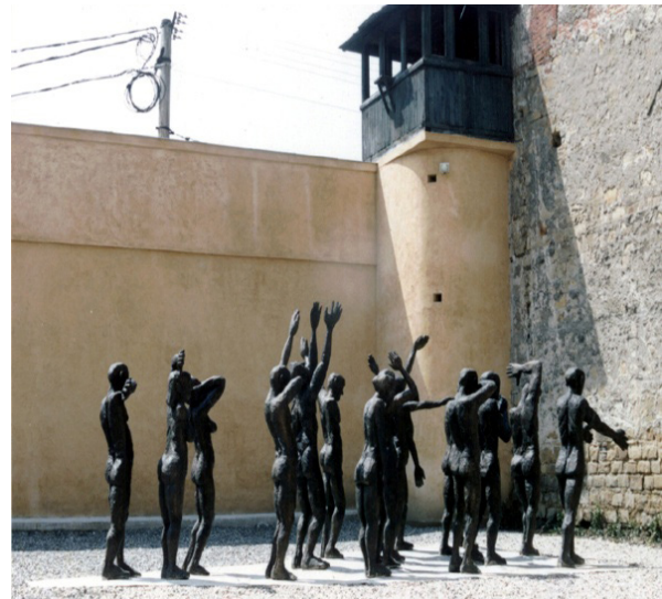
Fig. 3. Cortegiul sacrificiilor 3