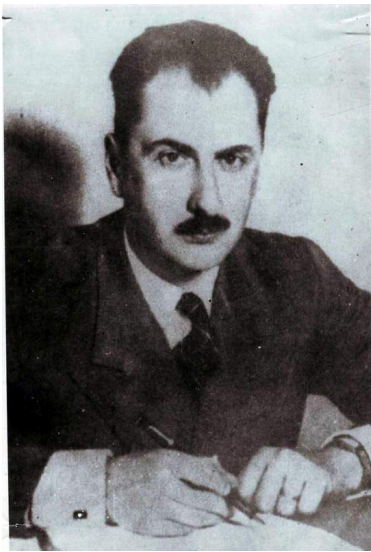
Fig. 1. Gheorghe I. I. C. Brătianu 1