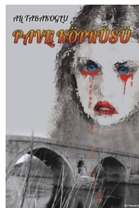
Imag. 2. Foaia de titlu a romanului scriitorului turc Ali Tabakoğlu „Pavli Köprüsü” („Podul lui Pavli”)