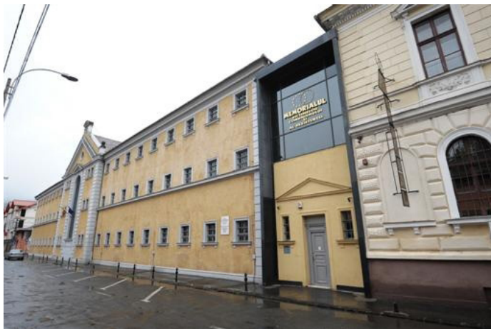
Fig. 2. Închisoarea Sighet 2