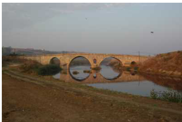
Imag. 1. Podul lui Pavli (Pavli köprüsü / Pehlivan köyü Akarca Köprüsü)

Maria îl implora pe soțul ei să o scoată din groapă, dar el a rămas impasibil. La întrebările soției: „Cine îi va face baie și-l va hrăni la sân pe fiul lor?”, el a răspuns: „Vor porni ploile și-l vor spăla, vor sufla vânturile și-l vor legăna!”. În timpul acesta, câteva fete tinere aduceau pietre la pod. Fetei care venea din urma celorlalte, i-au strigat: „Iana, Iana, nu mai căra [pietre], podul deja este trainic!” Ultima piatră, aruncată de Iana de pe capul său, se află și astăzi lângă pod, iar urmele degetelor fetei sunt încă vizibile pe această piatră de marmură. La împlinirea vârstei de 14 ani Iuvanciu s-a dus la pod, auzind un glas care i-a vorbit următoarele: „Iuvanciu, vino încoace!”.