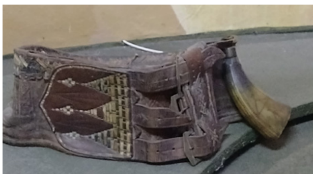
Imag. 5. Chimir din piele, imprimat și brodat, cu trei cataramе, sf. sec. al XIX-lea. Expoziție la Muzeul Național de Etnografie și Istorie Naturală al Republicii Moldovei.