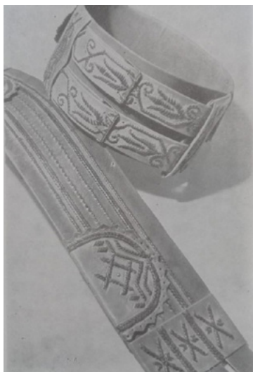
Imag. 3. Chimir din piele cu trei cataramे, ornamentat prin brodare cu fire din piele, înc. sec. al XIX-lea (Тесленко 1978: 95)