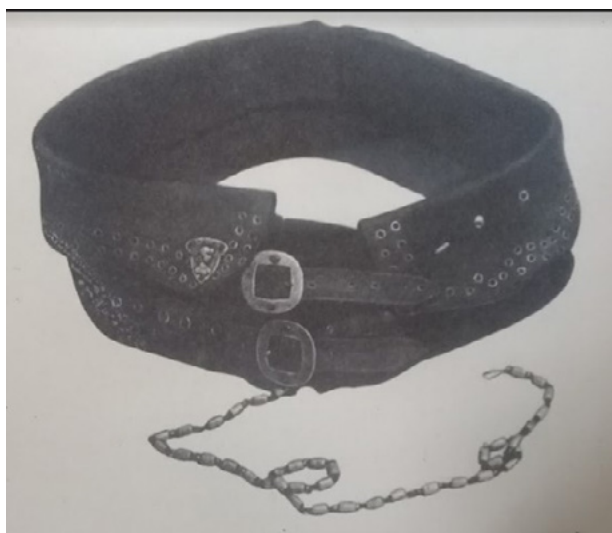
Imag. 2. Chimir din piele, ghintuit cu elemente metalice, cu două cataramă de bronz, înc. sec. al XIX-lea (Димитриу 1975: 109)