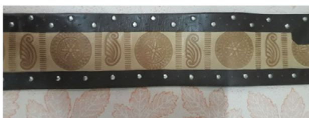
Imag. 7. Chimir din piele ornament cu motive geometrice și vegetale stilizate executate prin imprimare, ștanțare și nituire la margine de la nordul țării, or. Soroca.