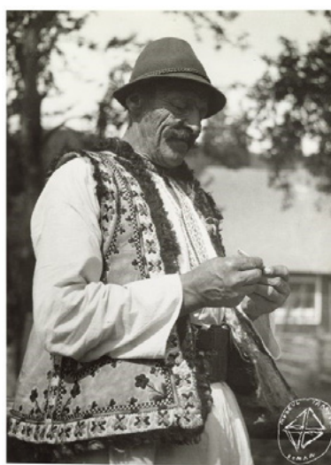
Imag. 6. Articole din piele purtate de țaran.