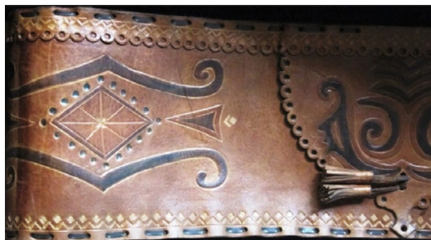
Imag. 4. Chimir din piele de la înc. sec. al XIX-lea, ornament prin imprimare, ștanțare, perforare, coaserea pe margine cu fire din piei. Expoziție la Muzeul Național de Etnografie și Istorie Naturală al Republicii Moldova. Foto de autor